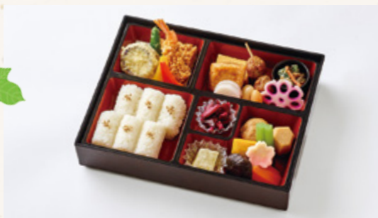
ひさまつ 久松 2,500円(税込2,700円)