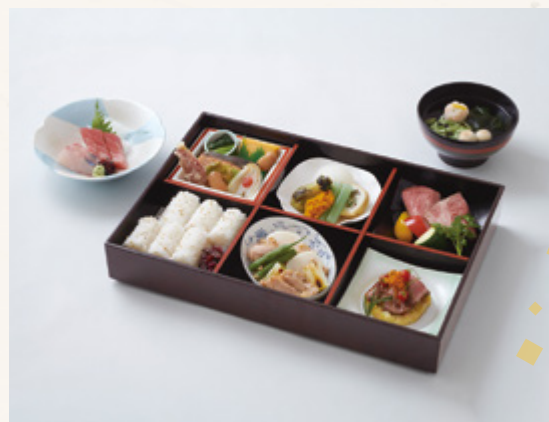
ようこう 陽光 5,000円(税込5,400円)