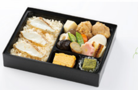
たい 鯛めし 1,600円(税込1,728円) サイズ 縦17cm×横22cm お茶 200円引 お茶付き