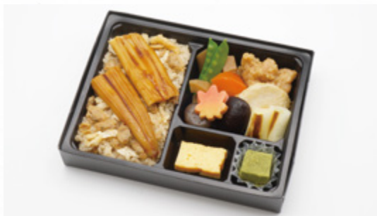
あなこ ふかがわ 穴子深川めし 1,600円(税込1,728円) サイズ 縦17cm×横22cm お茶 200円引 お茶付き

鮭西京焼をはじめ、カニフライや 鶏の照り焼きなど、彩り豊かな和の ごちそうを盛り込みました。おもてなしや 特別な席にもふさわしい折詰です。