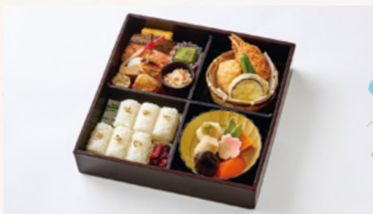
ちとせ 千歳 3,000円(税込3,240円)