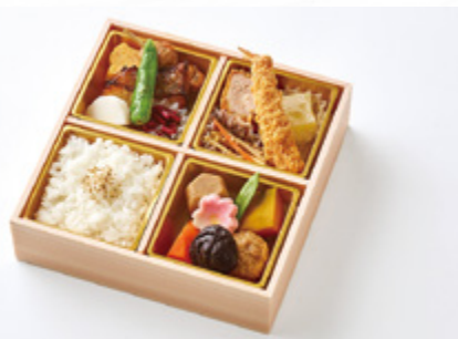
し おん 紫苑 2,000円(税込2,160円) サイズ 縦19.5cm×横19.5cm

味噌の旨味を味わえるカレイ江戸甘味噌焼きや 食べ応え抜群のエビフライやヒレカツ、 柚子わらび餅のデザートまで楽しめる 折詰です。