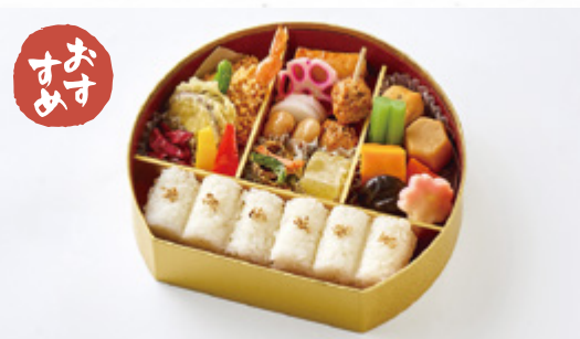
こちょう 胡蝶 2,500円(税込2,700円) サイズ 縦19.5cm×直径21.5cm

江戸甘味噌で炊き込んだ深川めしに、 柔らかく炊き上げた穴子を添え、 彩り豊かなおかずを詰め合わせた 豪華な折詰です。