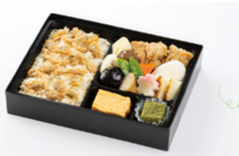
ふかがわ 深川めし 1,450円(税込1,566円) サイズ 縦17cm×横22cm お茶 200円引 お茶付き

香ばしく焼き上げた目黒木の照り焼きや、 食感も楽しい海老あられ揚げ。 お出汁が染みわた炊き合わせなどが楽しめる、 豪華な折詰です。