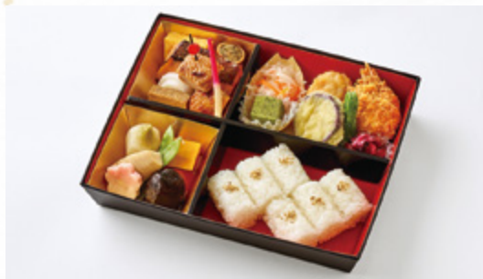
こすもす 秋桜 3,000円(税込3,240円) サイズ 縦20cm×横26.5cm

観劇の幕間にて楽しまれ、長年多くのお客様に 親しまれてきた、伝統の幕の内折詰です