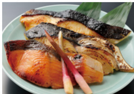
西京焼盛り合わせ

明治座の西京漬とは 厳選された西京味噌にもろみ味噌を合わせた 明治座オリジナルブレンドの味噌を使用。 職人が毎日ひとつひとつ丁寧に漬けており、 袋詰めから発送に至るまですべて手作業で行い、 心を込めて作っています。