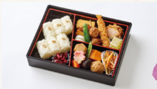
きしょう 喜昇 2,000円(税込2,160円)