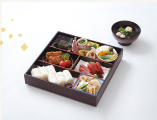
ずいろうん 瑞雲 4,000円(税込4,320円)