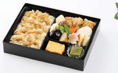
ふかがわ 深川めし 1,450円(税込1,566円)