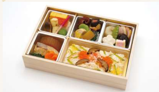
はな 花すすき 3,800円(税込4,104円)

四季のある日本はそれぞれの季節で旬を楽しめます 日本古来の伝統「和食」と「冬の味覚」をお楽しみください