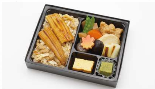
あな こ ふかがわ 穴子深川めし 1,600円(税込1,728円)

江戸甘味噌で炊き込んだ深川めしに、 柔らかく炊き上げた穴子を添え、 彩り豊かなおかずを詰め合わせた 豪華な折詰です。