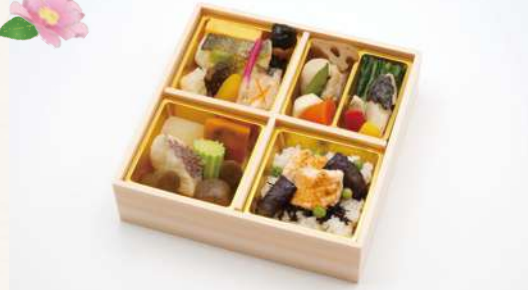
し おん 紫苑 2,200円(税込2,376円)