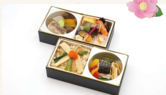
こ ちょう 胡蝶 2,800円(税込3,024円)

スズキ木の芽味噌焼きや海老白煮など 多種多様な食材をあしらひ、 筍御飯を添えた雅やかな二段弁当です。