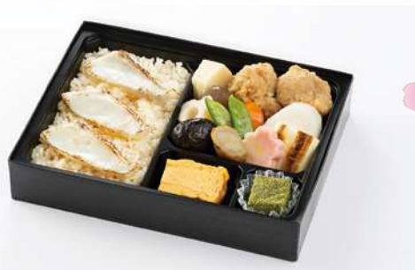
たい 鯛めし 1,600円(税込1,728円)