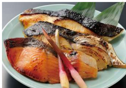
西京焼盛り合わせ

明治座の西京漬とは 厳選された西京味噌にもろみ味噌を合わせた 明治座オリジナルブレンドの味噌を使用。 職人が毎日ひとつひとつ丁寧に漬けており、 袋詰めから発送に至るまですべて手作業で行い、 心を込めて作っています。